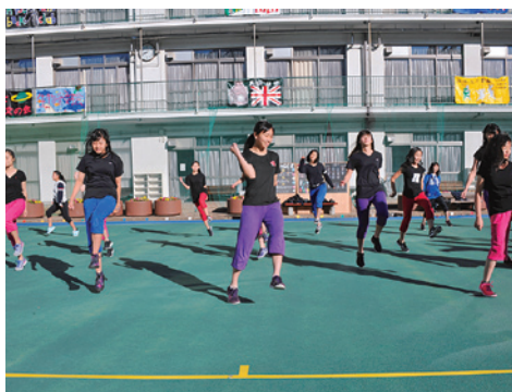
近代劇研究会 ダンス班