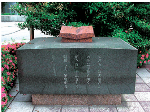
慶應義塾発祥の地

慶應義塾は2008年に創立150年を迎えました。したがって、その創立は、1858年ということになります。所は、江戸の築地鉄砲洲 てっぽう にあった中津藩中屋敷の内で、今はこの地は聖路加国際病院の構内 せいろか にあり、病院前の道路上緑地帯に「慶應義塾発祥の地」の記念碑が建てられています。