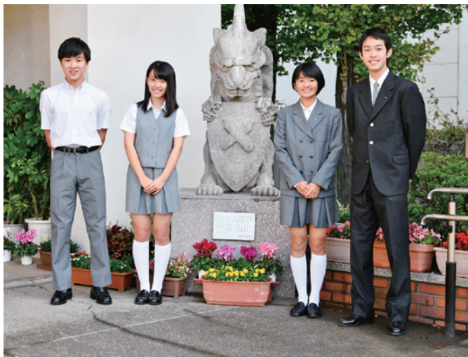
基準服（夏服と冬服）

中等部の服装に対する考え方は、自己の判断、あるいは家庭の協力によって、年齢にふさわしい、しかも個性を生かした服装をすることにあると言えます。ただ、それにはその判断のよりどころとなるものを与えなければなりませんし、中学生という年齢層には、時には、はっきりした基準を示さなければなりません。それが、中等部の基準服ということになります。