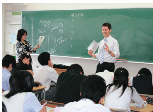
ネイティブスピーカーとのチームティーチング

英語では、各学年とも週2時間、ネイティブスピーカーと日本人の教員と一緒に1つの教室で授業を行うチームティーチングを実施しています。この授業でのコミュニケーションの手段は主に英語です。さらに各学年とも週1時間、生徒の習熟度を考慮した少人数クラス編成による授業が行われています。こうした授業では、より実践的な英語の運用能力を高めることを目標としています。また、